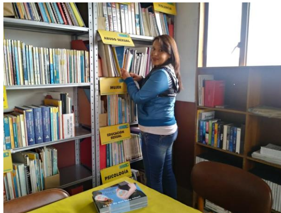
Anexo 14: Capacitaciones a Profesionales Asociación Afecto.