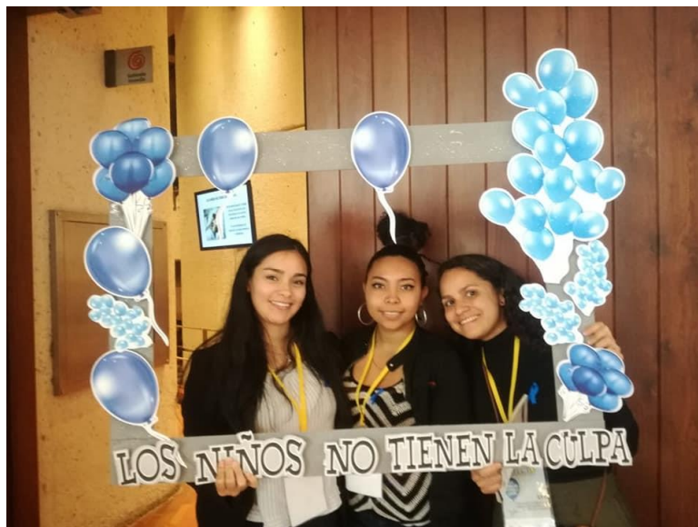
Anexo 7: Fotografía - Participación de la Asociación Afecto en Convenciones Contra el Maltrato Infantil.