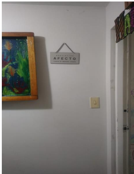
Anexo 3: Fotografía - Grupo de estudio con profesionales Asociación Afecto.