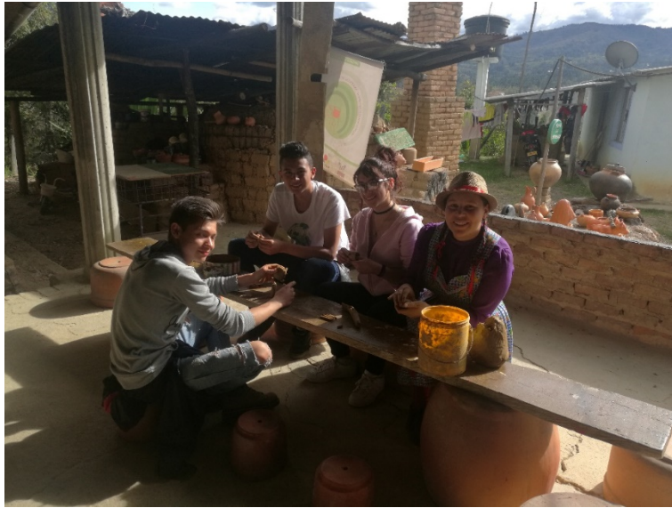
Imagen 3. Estudiantes Turismo en salida al Departamento de Boyacá