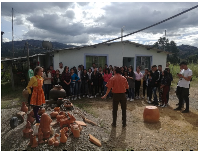
Imagen 2. Estudiantes Turismo en salida al Departamento de Boyacá