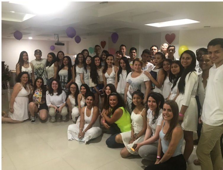
Imagen 1. Estudiantes Turismo en salida al Departamento del Tolima

En las salidas pedagógicas se hace de vital importancia los procesos de visibilización del programa y de la Universidad Colegio Mayor de Cundinamarca, en cada uno de los atractivos turísticos visitados; se busca interactuar con la cultura y las tradiciones de cada una de las regiones.