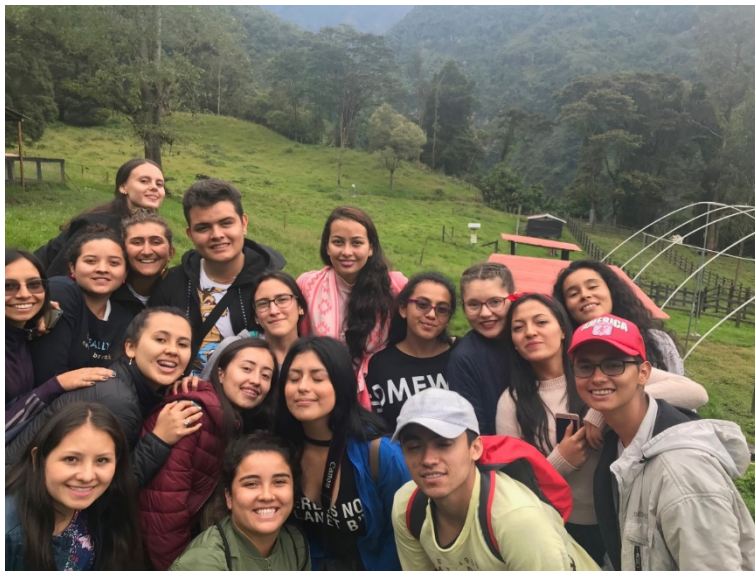
Imagen 1; Estudiantes Turismo en salida al Departamento del Tolima

Dentro de los planes de mejora y al realizar un proceso interdisciplinario en el programa de turismo se resalta la importancia que tiene para los profesionales en turismo la adquisición de una lengua extranjera (inglés) y al contar con este dentro de la estructura curricular se implementa el convenio con el que cuenta la Unicolmayor entre ICETEX- Ministerio De Educación- Embajadas de: Reino Unido, Francia, India,