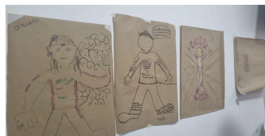
Foto: Cartografías corporales de integrantes de la Chirri House (2023)

Por otro lado, a partir de la cartografía corporal se permitió el reconocimiento del concepto que las personas participantes que integran la Chirri House le otorgan a su familia elegida a través de sus experiencias de vida, así como también el aporte de esta unión en sus proyectos de vida y en su tránsito por el género, permitiendo no solo descubrir su sentido de pertenencia dentro de la Chirri House, sino también un reconocimiento propio de sus procesos y vivencias personales. De esta manera, se evidenciaron respuestas como: