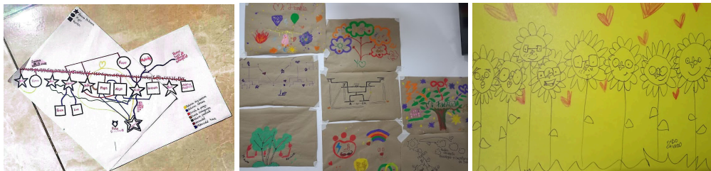
Fotos. Genogramas con enfoque diferencial por orientaciones sexuales e identidades de género.