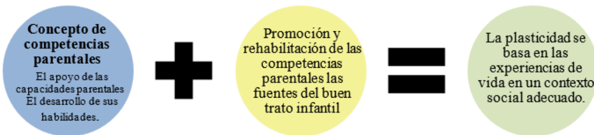
Figura 3: Buenos tratos

Tomado de Barudy, 2005. Adaptado por Urrego 2022