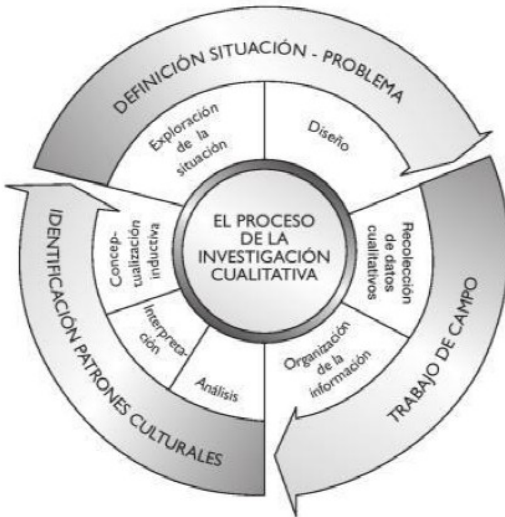
Diagrama 1. Proceso de investigación cualitativa de Elsy Bonilla 55 .