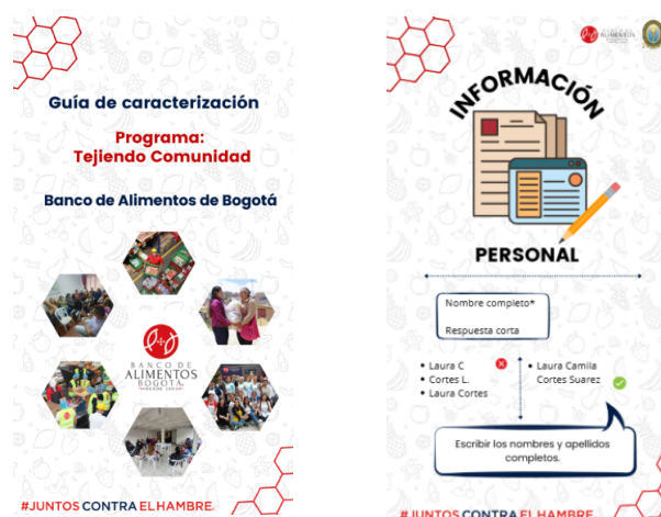
Guía de caracterización de familias

Nota: Información recopilada de la Guía de caracterización a familias, (2025).